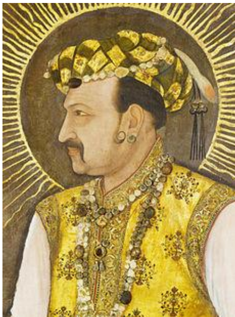
تصویر ۱۱- جهانگیر شاه، اثر مانوهر، ۱۵ م، موزه آرمیتاژ (Indian painting).

در کاخ‌ها و تالارهای عمومی جهانگیر تصاویر مذهبی اروپایی، حتی با موضوعات مبهم و کنایه‌دار، کاملاً به چشم می‌خورند. با این وجود شواهدی دال بر توجه جهانگیر نسبت به موضوع تصاویرش موجود است. از این رو هنرمندان دربار او تخصص بی‌نظیری در چهره‌سازی و پیکره‌نگاری داشتند. یکی از هنرمندان نقاش دربار جهانگیر شاه، مانوهر بود. مانوهر به‌عنوان نقاش چهره‌نگاری کار می‌کرد که کمتر با روحیه‌اش سازگار بود، اما وی عمر طولانی خود را با خدمت به پسر شاه جهان یعنی دارا شکوه به پایان برد. وی به‌واسطه‌ی استعدادش در چهره‌نگاری و به‌خصوص در نوع تمثیلی آن پیشرفت کرد. او رؤیاهای جهانگیر را برای فتح جهان یا برتری وی بر جامعه‌ی شیوخ و صوفیان برای اهمیت بخشیدن به پادشاهی تصویر می‌کرد. در نگاره پرتره جهانگیر شاه (تصویر ۱۱) وی تلاش کرده است که حجم‌نمایی و واقع‌گرایی را به هنر هند که متأثر از هنرمندان مکتب صفوی نیز هستند اضافه کند. پرداخت کافی در چهره و پیکره شاه انجام شده است ولی تجمل و اشرافیت در وجنات او دیده نمی‌شود. برای شکوه و عظمت بیشتر به وجهه شاه، هاله نور در اطراف صورت وی نقاشی شده است.