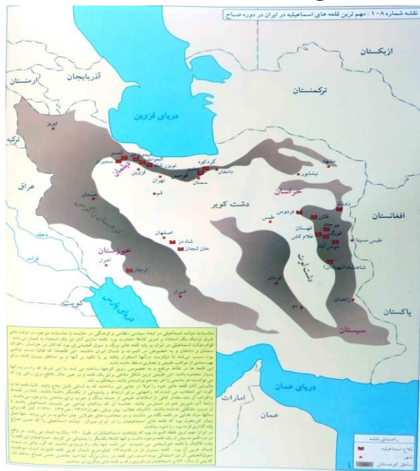
نقشه شماره ۱؛ قلمروی اسماعیلیه نزاری ایران در دوره الموت

نداشتند و مخالفان دستگاه خلافت سنی مسلک عباسیان که در پی استقرار امامت حقیقی و حکومت آرمانی اسلامی بودند، تحت پوشش عقاید شیعی اسماعیلی نزاری، نهضت نزاریه ایران در دوران الموت را یاری رساندند و از عناصر مهم آن گردیدند. این جامعه از دیدگاه انسجام اجتماعی، جامعه ای به شدت همبسته و مسنجم بود بگونه ای که کمترین میزان گسستگی های اجتماعی در آن مشاهده می شود.