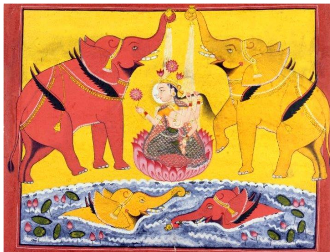
تصویر ۱۰- الهه لاکشمی، محل نگه‌داری؟ ۱۷ م (Baron, 1940)

لاکشمی ایزد بانوی ثروت است و پول و غله و گله و زمین و طلا و نقره از عطایای اوست. در متون هندو گفته شده هر جا که سلطنت و ثروت و شهرت و شوکت باشد، فیض لاکشمی در آنجا حاضر است و لاکشمی نیز در آنجا حضور و سکونت داشته است.